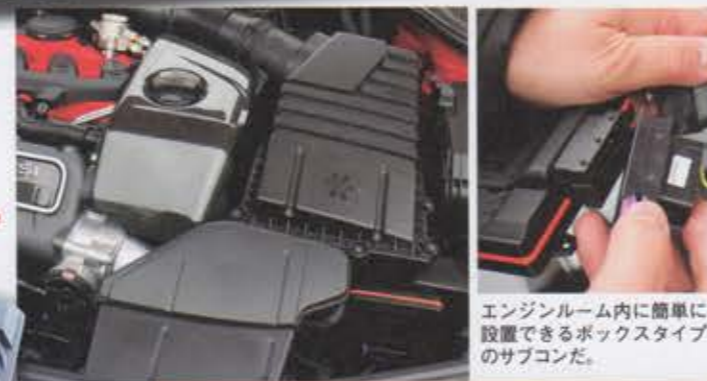
エンジンルーム内に簡単に設置できるボックスタイプのサブコンだ。