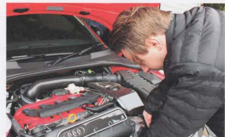
ドイツTUV認証工場による製品製造を行うとともにドイツ国内においては燃費向上も認められており、そのパフォーマンスは疑う余地のないものだ。

日本語で手順画像付きの詳細な取り付け説明書も同梱。日本ディーラーならではの対応だ。